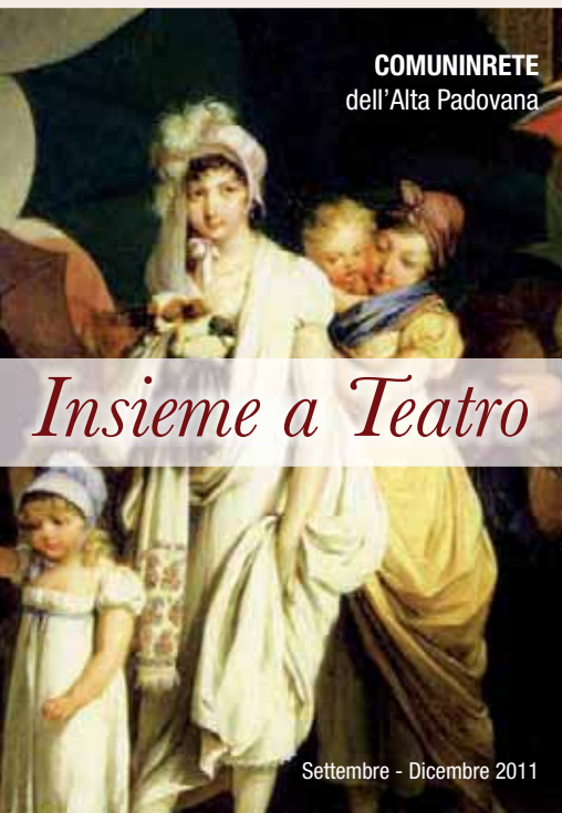
COMUNINRETE dell'Alta Padovana