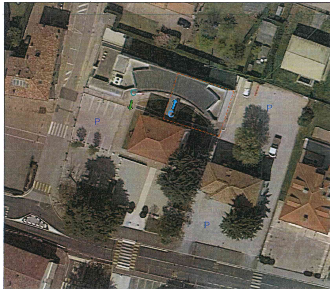
VISTA DI INSIEME DELL' EDIFICIO CHE OSPITA L'AREA CONCURSUALE

PIANO OPERATIVO DI CUI AL PROTOCOLLO DI SVOLGIMENTO DEI CONCORSI PUBBLICI DI CUI ALL'ART. 1, COMMA 10, LETTERA Z) DEL D.P.C.M. 14 GENNAIO 2021. NOTA DIPARTIMENTO DELLA FUNZIONE PUBBLICA - UFFICIO PER I CONCORSI E IL RECLUTAMENTO - N. 0007293-P-03/02/2021.